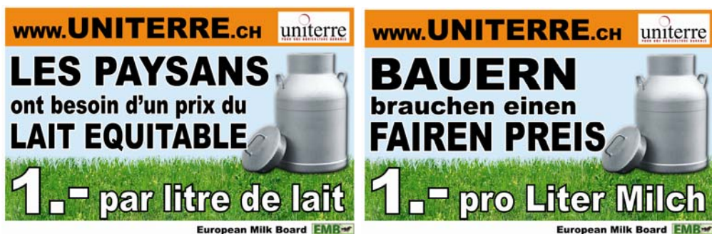
Figure 5 panneaux disposés actuellement au bord des routes

En Suisse alémanique, l'organisation BIG-M (Bäuerliche Interessengruppe für Marktkampf) est active pour la campagne. Elle regroupe officiellement plus de 300 producteurs qui revendiquent un prix du lait équitable.