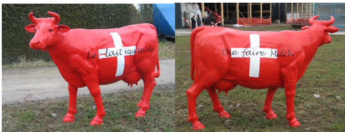
Figure 4 Visuel de la vache Justine/Faironika/ Onestina/ Giustina