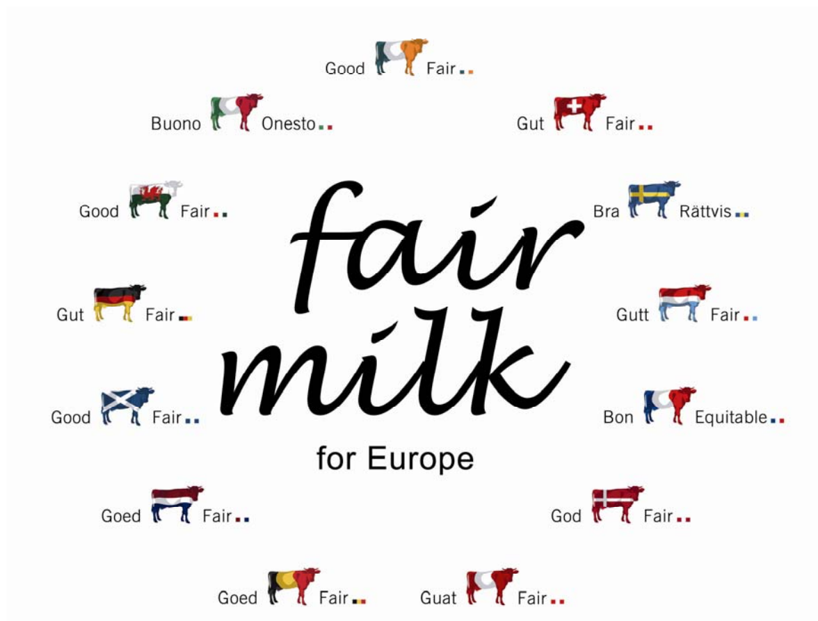
Figure 1 logo officiel de la campagne européenne pour un prix du lait équitable