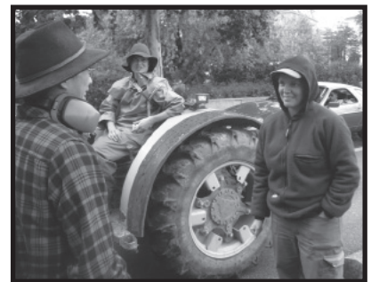
Jeunes à Genève lors de la révolte.

Des jeunes en Suisse, en Europe et dans le monde au sein de La Via Campesina unissent leurs forces pour remettre ces enjeux à l'ordre du jour. Un de leur objectif est de créer dans chaque organisation membre de La Via Campesina, un groupe de jeunes qui aurait comme objectif principal d'éclairer les organisations sur leurs problématiques spécifiques et de les faire avancer.