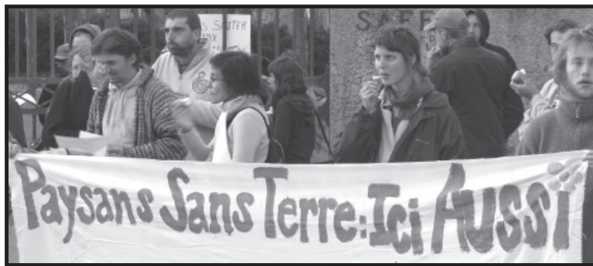
Jeunes de «Reclaim the Fields» à Montpellier devant la SAFER.

De nombreux jeunes souhaitent embrasser le métier de paysan. Les écoles d'agriculture ne désespèrent pas, beaucoup de jeunes cumulent d'ailleurs deux formations. Mais pour eux, l'accès à la terre n'est pas simple.