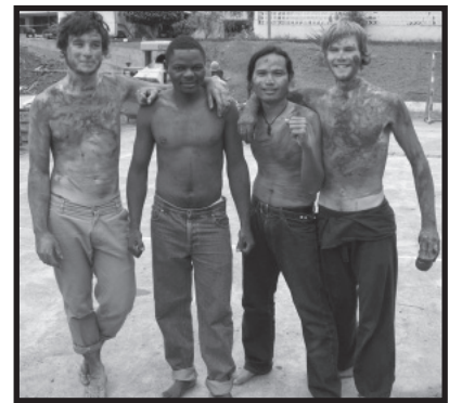
Jeunes de La Via Campesina à Maputo lors de la Vieme conférence internationale.

faut s'en inspirer et les adapter à nos réalités.