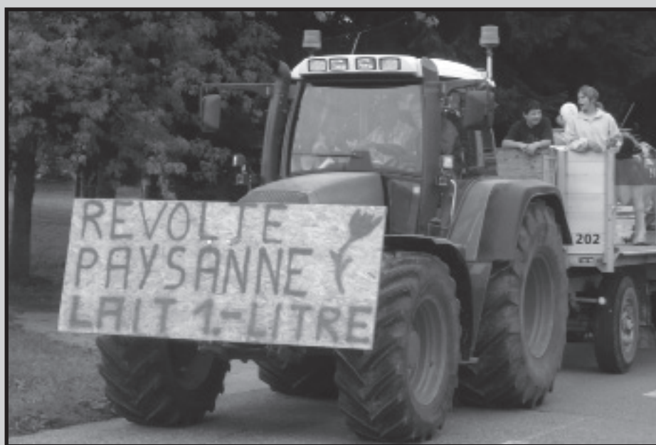
L'ensemble de la Suisse romande a pris part à la révolte, comme ici, à la Chaux-de-Fonds.

Lorsqu'au début des années 1990, Uniterre a fait partie des membres fondateurs de la Coordination paysanne européenne (devenue Coordination Européenne Via Campesina), c'est parce que votre syndicat avait saisi que tout ne pouvait se résoudre au plan national. Qu'ici comme ailleurs, nous vivons des problématiques similaires et qu'unis nous sommes plus forts! Il y