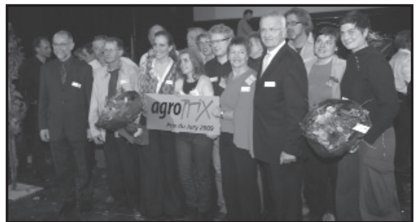
Attribution du prix du jury d'une valeur de 20'000 francs.

Par ailleurs, dans le cadre du lien direct entre ville et campagne, nous serons une force pro active pour encourager les collectivités publiques à prioriser la production locale dans leurs achats (crèches, écoles, cantines, hôpitaux, EMS etc.).