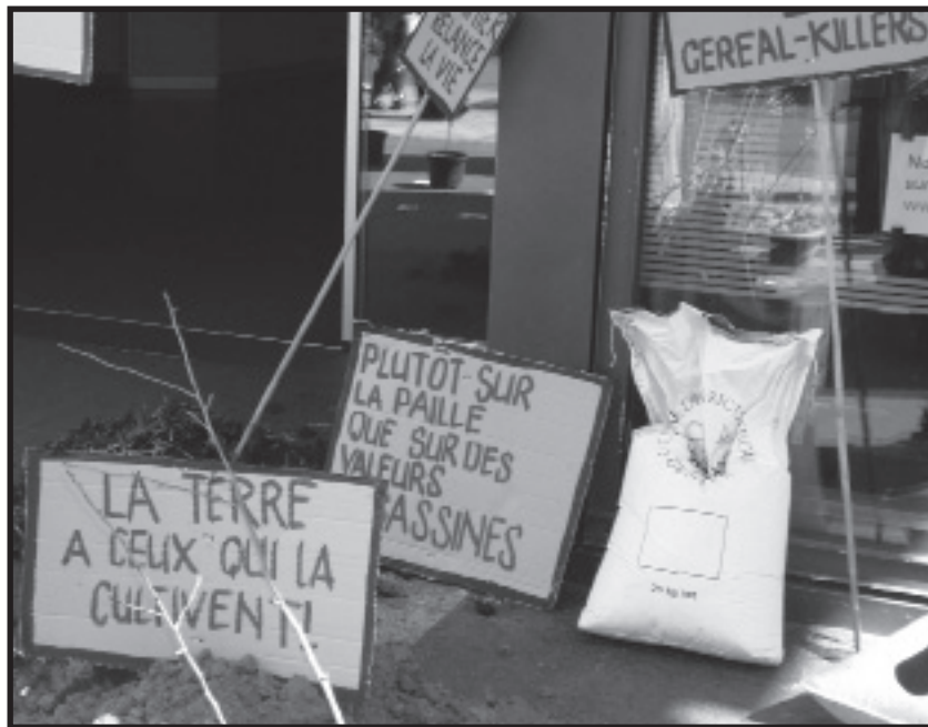
Un 17 avril à Genève, réaction paysanne au sauvetage de l'UBS...

pour reconstruire, là où elle a presque disparu, la production locale. C'est la seule manière pour devenir moins dépendant du commerce mondial sou-