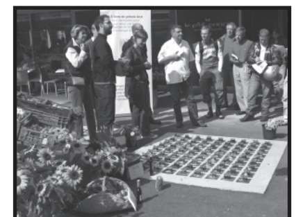
Jardins du Flon à Lausanne.