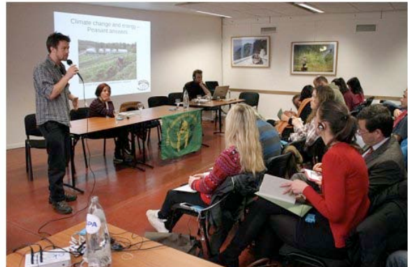
Schéma de la Transmission en agro-écologie en Belgique

Centres de formation : Ecole Paysanne Indépendante (Fermes-Ecoles, formation préqualifiante), Centre de formation FUGEA, Formation Bio CRABE ( http://www.crabe.be/ )